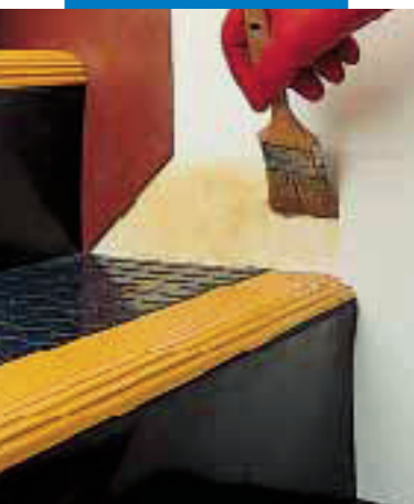
Gumi lábazat ragasztása Adesilex LP-vel