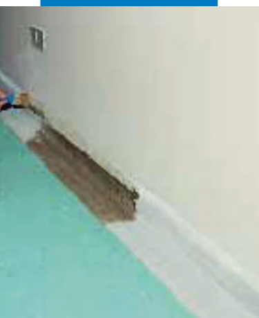
Istituto Tumori - Milánó. PVC padlóburkolat ragasztása Adesilex LP-vel

Az aljzatnak egyenletesen száraznak, síknak, megfelelő nyomó- és húzószilárdságúnak, pormentesnek, és a málló részeketől, repedésektől, festéktől, viasztól, olajtól, rozsdától, gipsznyomoktól és minden más, a tapadást gátló anyagtól mentesnek kell lennie.