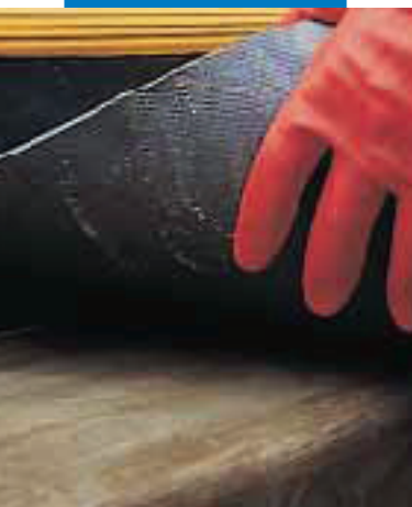
Gumi padlóburkolat ragasztása lépcsőre Adesilex LP-vel